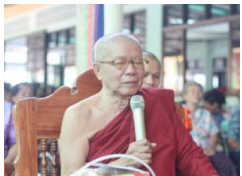
หลวงปู่ธัมมา พิทักษา ผู้สร้างพระธาตุเรืองรอง

ภายหลังจากการก่อสร้างวัด บ้านสร้างเรืองแล้วเสร็จ หลวงปู่ธัมมา พิทักษา ก็ได้มีแนวคิดว่าจะสร้างพระธาตุให้เป็นที่สถิตที่ชาวบ้านได้สักการบูชา โดยเห็นว่าชาวพุทธในเขตอีสานใต้ส่วนใหญ่มีฐานะค่อนข้างยากจน ปุชนิยสถานทางพุทธศาสนาแต่ละแห่งที่อยู่ห่างไกล เช่น พระธาตุพนม (ประมาณ 400 กม.) ประปฐมเจดีย์ (ประมาณ 600 กม.) พระพุทธบาทสระบุรี (ประมาณ 500 กม.) พระธาตุคอกสุเทพ (ประมาณ 1,000 กม.) โอกาสที่จะไปสักการบูชาปุชนิยสถานก็เป็นไปได้ยาก ดังนั้น หลวงปู่ธัมมา พิทักษา จึงตัดสินใจสร้างพระธาตุเรืองรองขึ้นที่วัดบ้านสร้างเรืองให้ผู้คนในเขตอีสานใต้ได้สักการบูชา